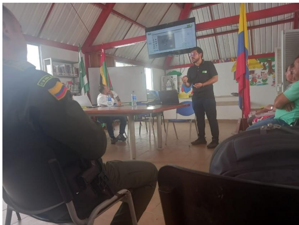
Cabildo municipal de Encino, personal apoyo semillero, ingeniero de simulación

De igual manera y con el propósito de socializar el avance en la elaboración del perfil productivo del municipio de Encino se realizó la siguiente presentación: