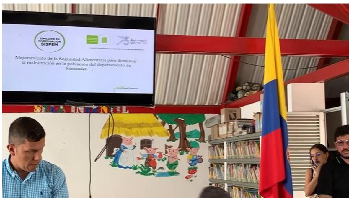
Cabildo municipal de Encino, personal apoyo semillero, ingeniero de simulación

En este orden, se realizaron los siguientes puntos para la construcción del documento del perfil productivo del municipio de Encino, el cual permitirá conocer las estrategias, programas y acciones, para contribuir en la toma de decisiones en la disminución de la malnutrición en la población de Encino.