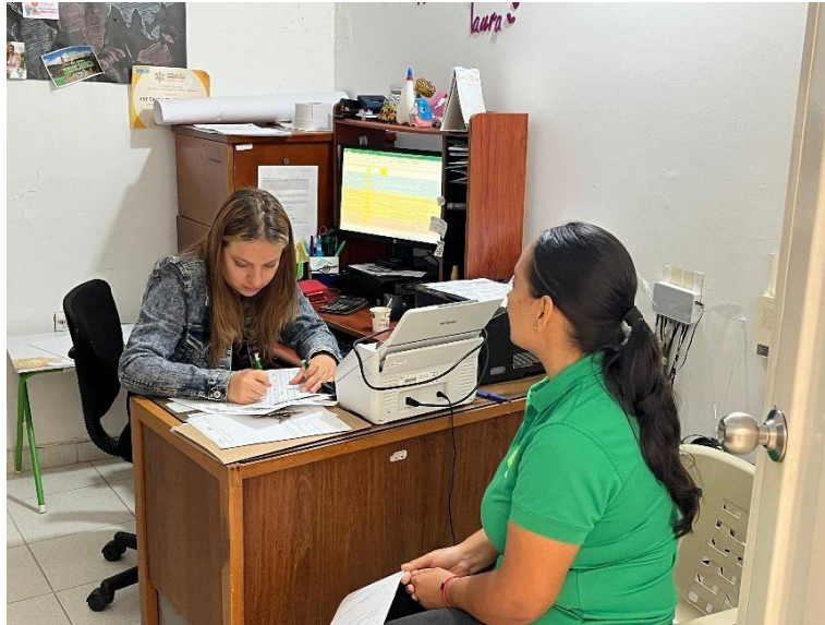
Reunión E.S.E Centro de Salud Encino