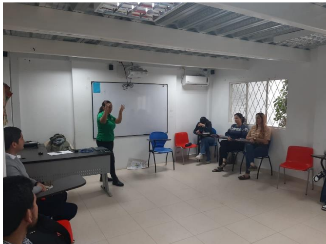
Reunión actores institucionales Alcaldía de Encino. Junto al estudiante de economía (semillero)

A partir de esta reunión se elaboró el contenido para el diagnóstico de la situación alimentaria y nutricional, presentado a continuación: