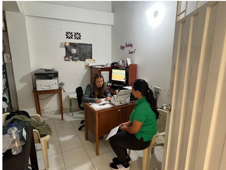
Reunión E.S.E Centro de Salud Encino