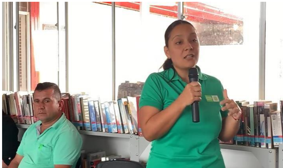
Cabildo municipal de Encino