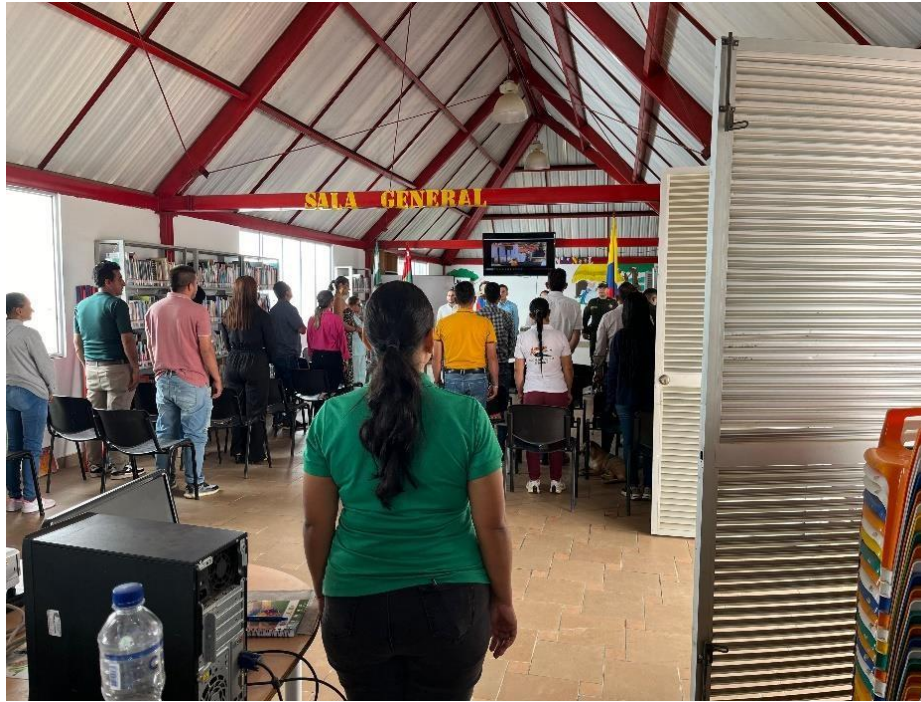
Cabildo municipal de Encino