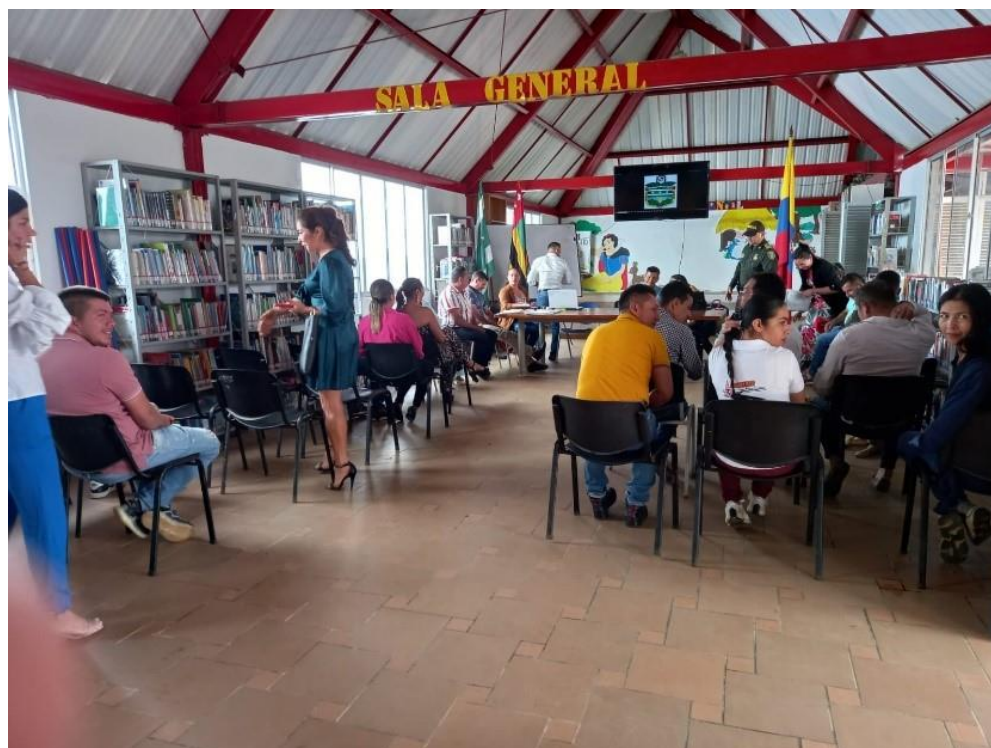
Cabildo municipal de Encino, personal apoyo semillero, ingeniero de simulación