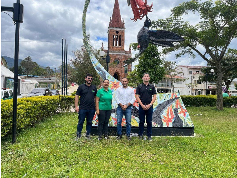
Fotografía alcalde de encino, ingeniero de simulación, estudiante de economía (semillero) y socióloga